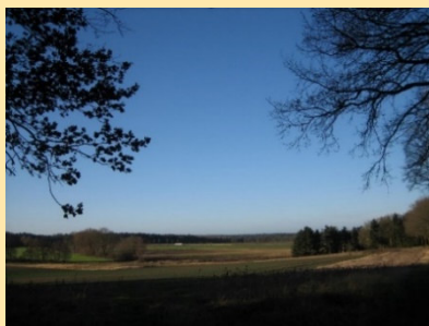
Blick ins Mausestal