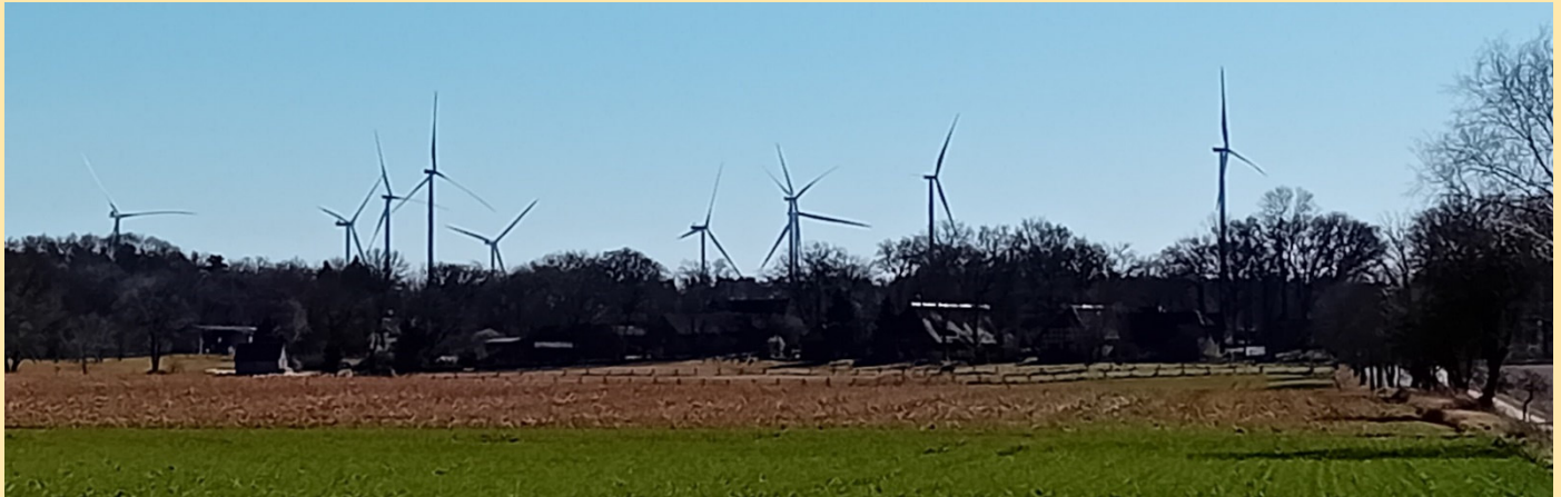
Blick auf Bohndorf in Richtung Bostelwiebeck – Windräderhorizont statt Dorfhorizont